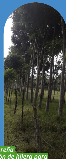
Plantas de Caoba hondureña establecidas en formación de hilera para cercas vivas, sombra y madera.

D Las especies de árboles a sembrar serán definidas en función de las condiciones climáticas y del suelo de la finca y de las recomendaciones de los técnicos forestales y frutales de los ministerios de Medio Ambiente y Agricultura.